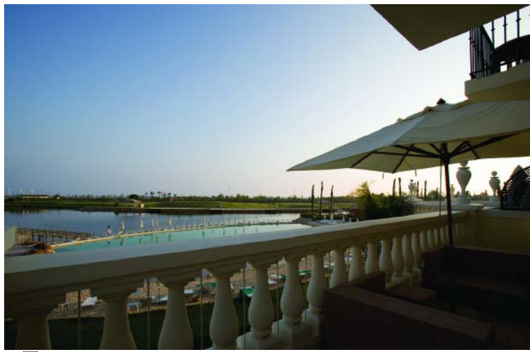
ATMOSFERAS 88 89